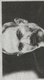
Армения - мэр: Пашинян отреагировал на заявление США