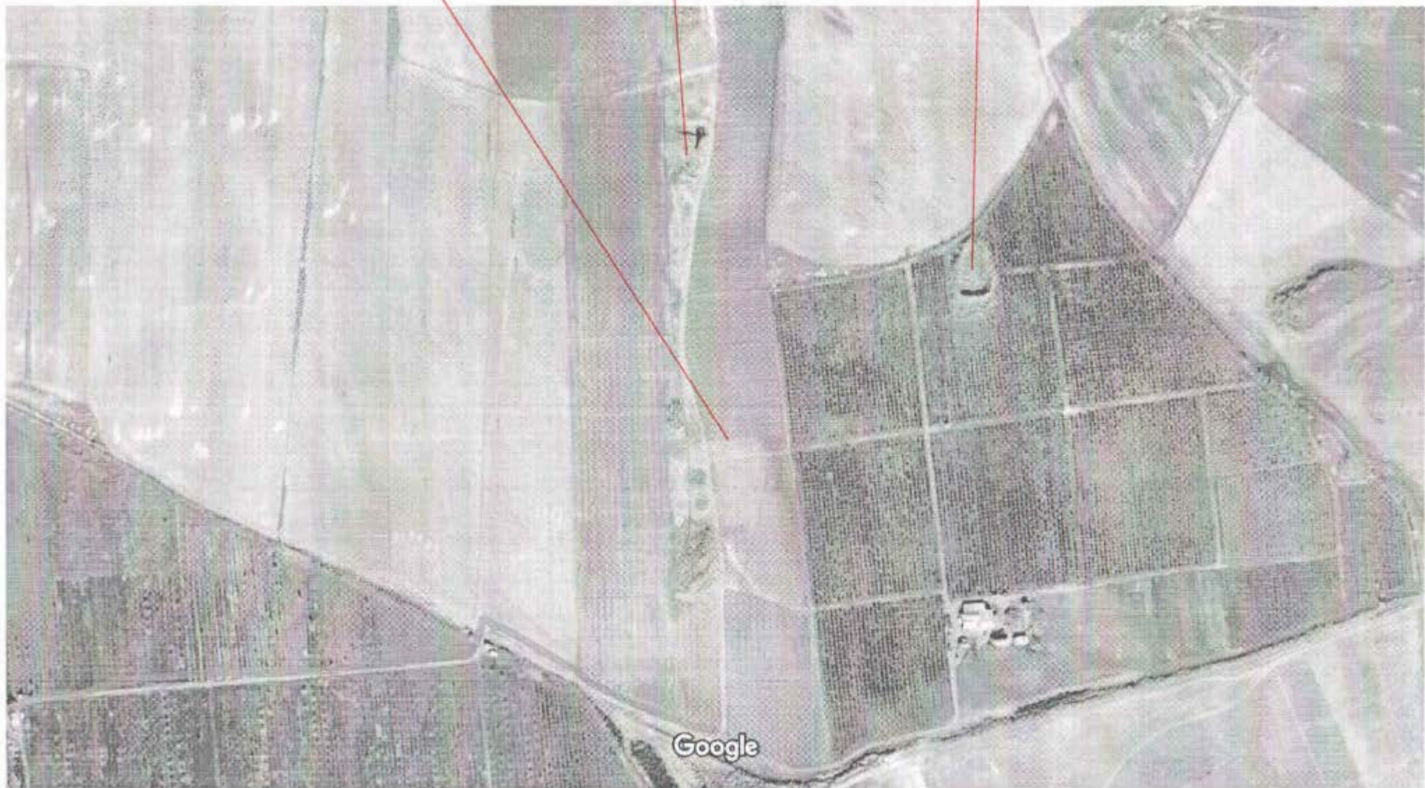
100 м

16) 07-031-0209-0032 15) 07-031-0209-0031 14) 07-031-0209-0030