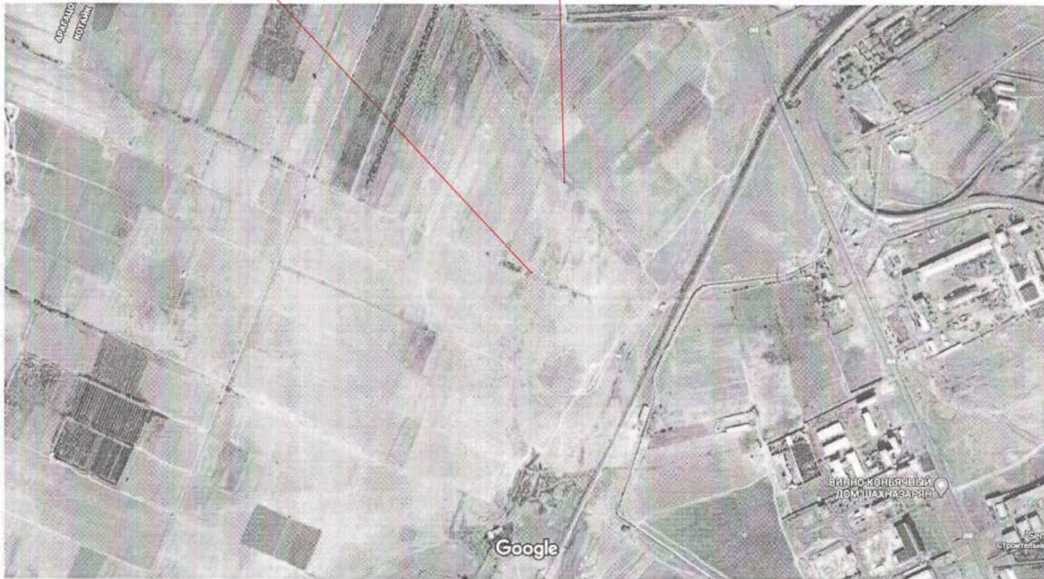
Изображения © CNES / Airbus, Maxar Technologies, 2020. Картографические данные © . 2020 200 м