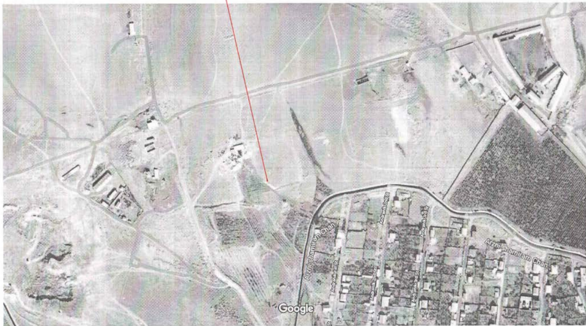
Изображения © CNES / Airbus,Maxar Technologies, 2020,Картографические данные © , 2020 100 м