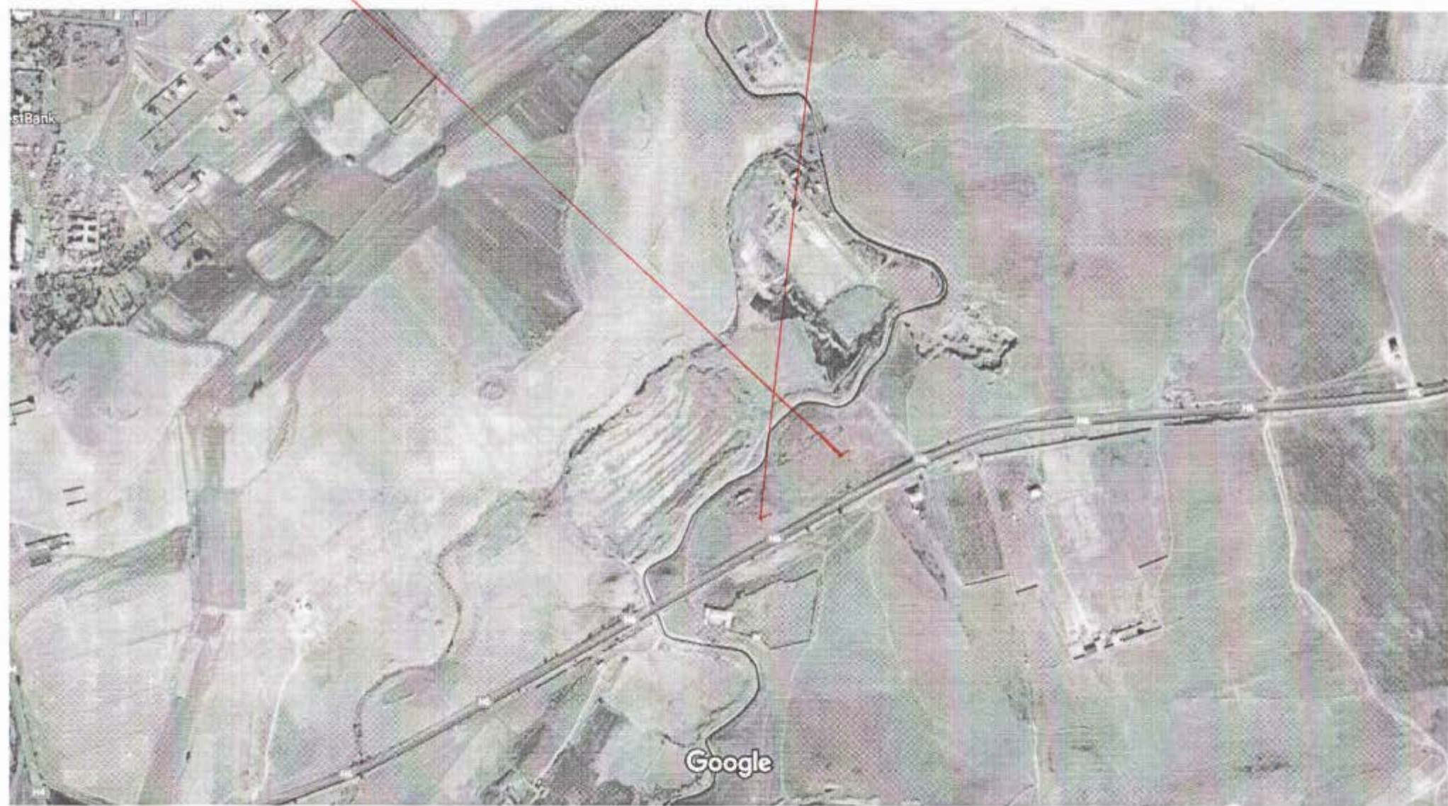
Изображения © CNES / Airbus, Maxar Technologies, 2020, Картографические данные ©, 2020 200 м